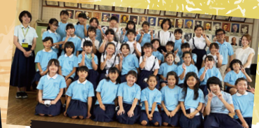
御幸小学校器楽部