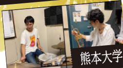
熊本大学モダンジャズ研究会